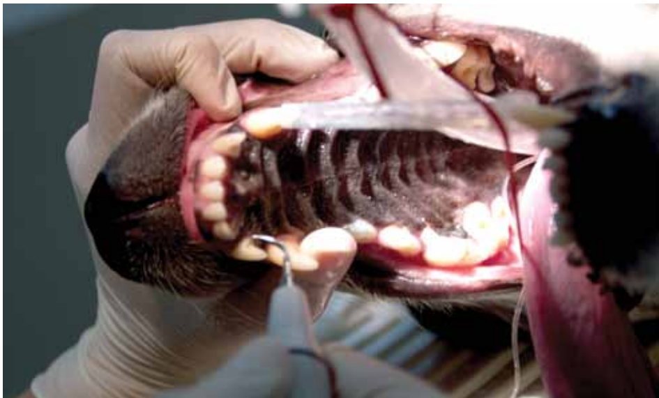
Hunder får sjelden hull i tennene. Det er bakteriene som er deres verste fiende. I tillegg til å lage problemer i munnhulen kan de vandre med blodet og lage problemer andre steder i kroppen.