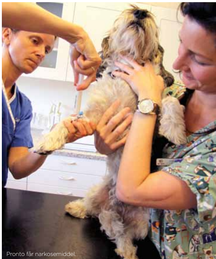
Pronto får narkosemiddel.