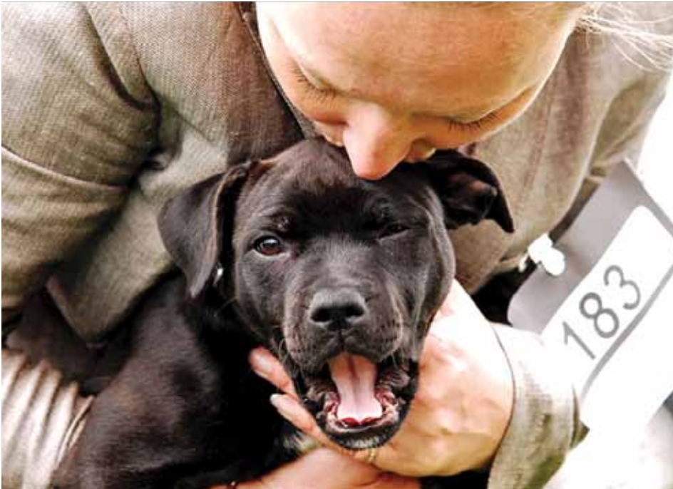
Staffordshire bull terrier på utstilling. Bildet har ingen tilknytning til saken.