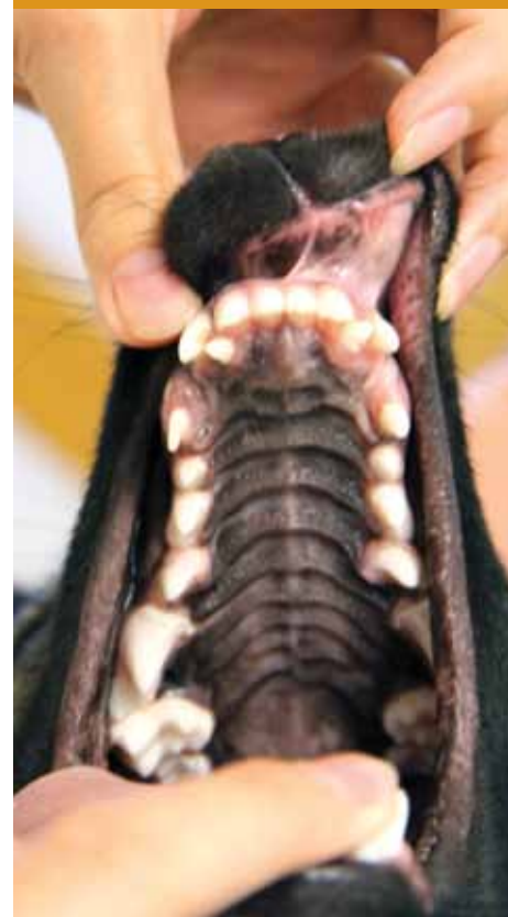
Her ser vi de to ekstra hjørnetennene som skal trekkes.

Tannskader kan oppstå akutt. En stein som tygges på, et stygt fall eller en påkjørsel. Dette er ikke noe man kan forebygge. Men man ►