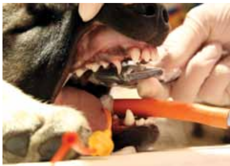
Røntgenplaten settes mellom tennene. Digitalisering gjør denne prosessen enkel.