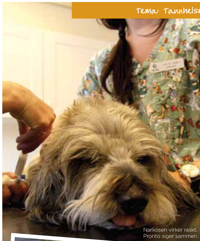
Narkosen virker raskt. Pronto siger sammen.