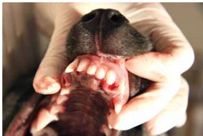
Tre hull tilbake som raskt vil gro seg til.

- Trekker vi tannen slipper hunden å ha det vondt. Men en tjenestehund kan ha behov for å beholde alle tennene, og da rotfyller vi, eller setter på en krone.