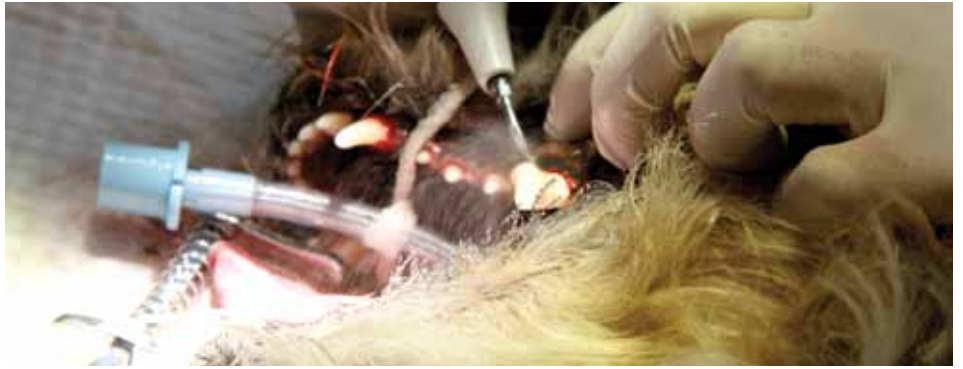
Tannbehandlingen går raskt med et ultralydhode.

- Det kan være på grunn av at de har en annen sammensetning av spyttet. Uansett så kan tannsten forebygges, først og fremst med tannpuss. Hver dag. Eller så ofte man kan. Man har jo