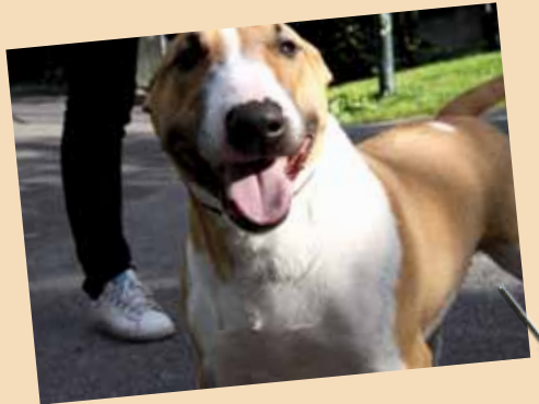
Mia (3 år) Bull terrier

Jeg får dental stick hver dag. Og så pusser jeg tennene så ofte eieren min orker. Jeg vet at det bør gjøres hver dag, men det er ikke så lett å få til det. Foreløpig er jeg ikke plaget med tannsten.