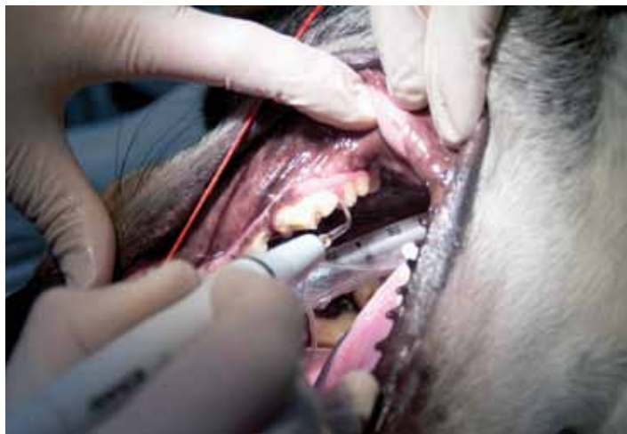
Irritasjon og betennelse i tannkjøttet er vanlig hos hund. Det kan ses som en tynn rød rand på kanten av tannkjøttet.