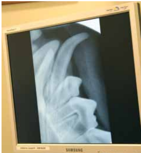
Bildet kommer raskt opp på skjermen.