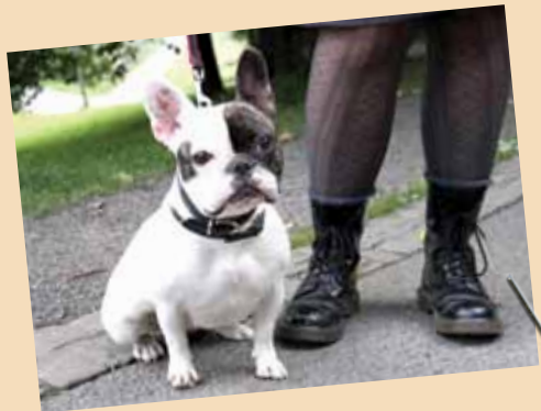
Emma (1 år) Fransk bulldog

Jeg får bare tørrfôr, og det er jo bra for tennene. Og så spiser jeg dental stick. Jeg har en tannbørste, men jeg liker ikke å bruke den. Derfor blir det ikke en puss mer enn kanskje en gang i måneden.