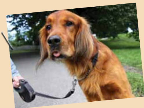
Verven (6,5 år) Setter/retriever

Jeg har akkurat fått ny eier. Hun gir meg dental stick. Hun har hatt mange hunder før, og de har aldri vært plaget med tannsten. Hun vet at hun ikke skal gi meg godteri, men tørrfôr. Og litt grønnsaker er kanskje også bra.