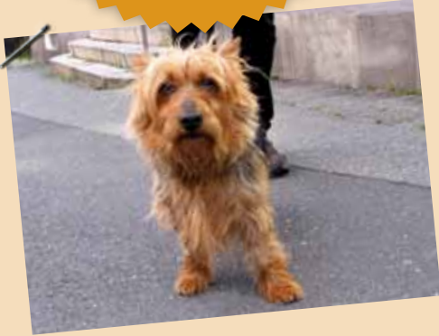
Hando (4 år) Australsk terrier

Hva gjør du for å ta vare på tennene dine?