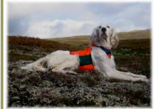
Engelsk setteren Tiril i en uvanlig avslappet posisjon..

sokk i sekken. Små overfladiske sår renses med saltvann. Større og dypere kutt skal inspiseres av veterinær og evt. sys. Slike kan også lett bli infisert og antibiotika kan være aktuelt. Under helingen må vevet få være i ro, og hunden få en hvileperiode.